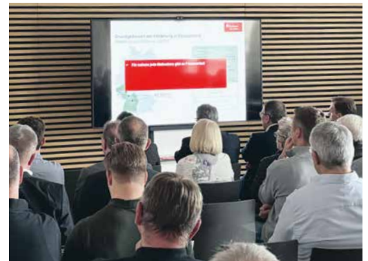
Kundenveranstaltung „Förderkredite und Energetische Sanierung“ im April 2024

Die energetische Sanierung von Gebäuden ist ein zentrales Thema. Neben den ökologischen Aspekten kann eine gut geplante Sanierung zu einer spürbaren Reduzierung der Energiekosten beitragen. Wir begleiten unsere Kundinnen und Kunden von der ersten Idee bis zur tatsächlichen Umsetzung – mit speziell auf ihre Bedürfnisse zugeschnittenen Angeboten. Informationsabende, der Modernisierungsrechner in unserer Internet-Filiale und die immer aktuellen Themen in unserem Newsletter bieten wertvolle Orientierungshilfen, um sich umfassend zu informieren. So schaffen wir optimale Voraussetzungen für ein persönliches Beratungsgespräch, das dann in einer fundierten Entscheidung für eine effiziente und energetische Sanierung münden kann.