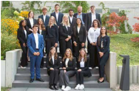
Unsere Auszubildenden des Jahrgangs 2024.

45 junge Menschen sind bei uns in einer Ausbildung oder in einem Studium. Wir bilden aus: • Bankkaufmann/-frau • Immobilienkaufmann/-frau • Fachinformatiker/-in • DHBW Studium mit der Fachrichtung Finanzdienstleistungen