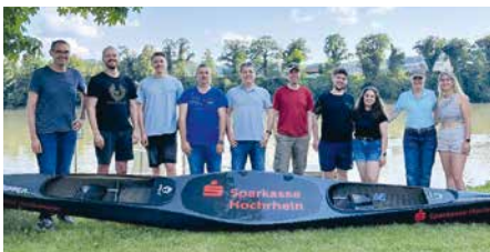
Ein starkes Team: Unsere GKB's mit den Senior-IKBs

Seit Jahren bilden unsere Gewerbekundenberatenden (GKB's) und Senior-Individualkundenberatenden (Senior-IKB's) ein starkes Team. Eine gute Partnerschaft funktioniert nicht nur am Schreibtisch – und so wurde es Zeit, das Teamgefühl auch außerhalb des Arbeitsalltags zu erleben. Gemeinsam ging es für unsere Beratenden im Gleichschlag per Drachenboot den Rhein hinab. Das Fazit: Wer generell an einem Strang zieht, erzielt auch auf dem Wasser großartige Ergebnisse.