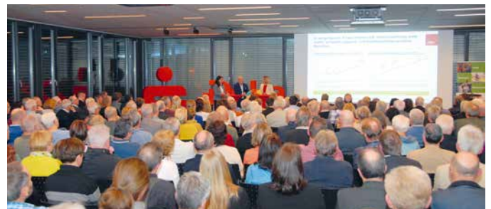
Quo vadis-Veranstaltung 2023 für Privatkundinnen und -kunden.