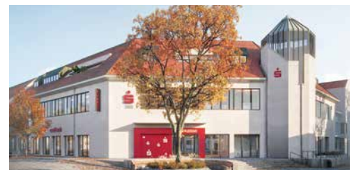
Die Sparkasse Bad Säckingen im neuen Design.

Nach 18 Monaten Umbau- und Sanierungszeit konnten wir im Frühjahr 2024 unsere Geschäftsstelle Bad Säckingen wieder für unsere Kundinnen und Kunden öffnen. Dem Sanierungskonzept unserer Bestandsimmobilien entsprechend haben wir den Schwerpunkt auf einen nachhaltigen Umbau nach ESG-Kriterien gelegt.