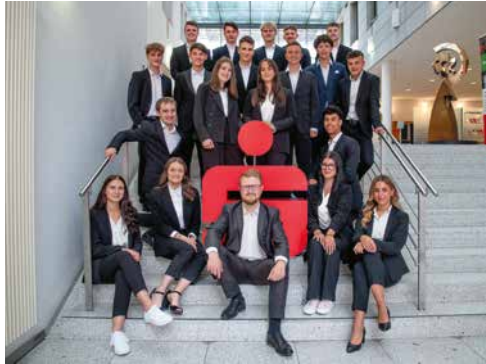
Unsere Auszubildenden des Jahrgangs 2023.

44 junge Menschen bilden wir aktuell aus: • Bankkaufmann/-frau • Immobilienkaufmann/-frau • DHBW Studium • Fachinformatiker/-in