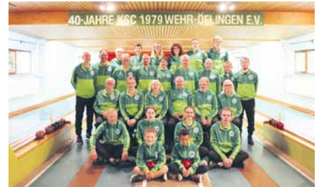
Der Kegelsportclub Wehr-Öflingen e.V. hat den dritten Platz erreicht. Dank dem Preisgeld konnten neue Präsentationsanzüge sowie Spielkleidung angeschafft werden.

Ein Teil unseres Förderengagements ist der seit 13 Jahren stattfindende Vereinswettbewerb. Unter dem Motto „Wir statten Vereine aus“ wurden im vergangenen Jahr 50.000 Euro an die Preisträger ausgegeben. Bewerbungen konnten sich Vereine mit konkreten Investitionswünschen für ihre Ausstattung.